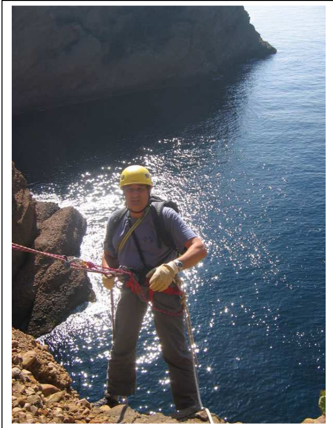
Le départ plein gaz de la cascade des Pirates