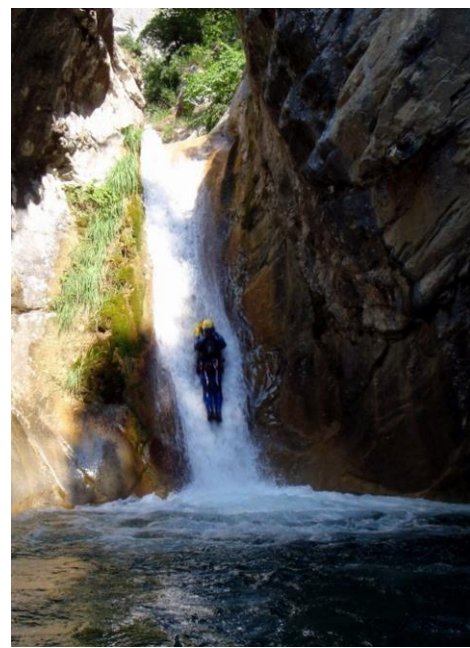
Un missile dans le 12m de la Maglia