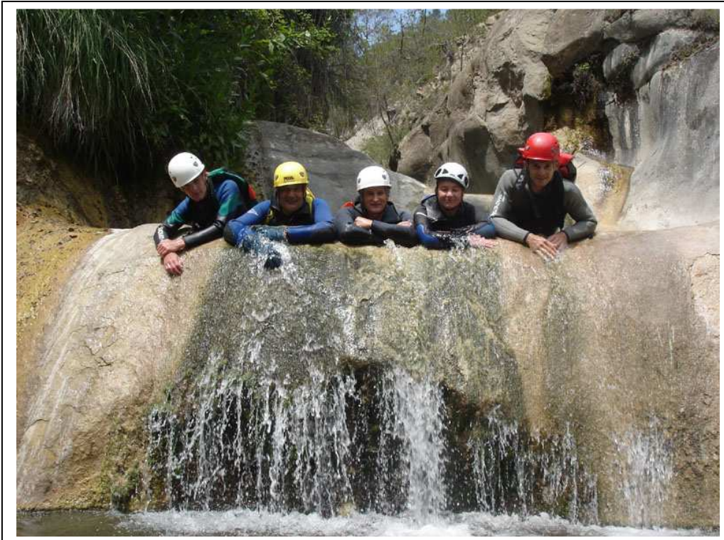
Nous faisons trempette dans lune vasque en escalier du final

Après 2 petits ressauts, nous entrons dans une gorge étroite en effectuant un premier rappel de 10 m suivi aussitôt par une très belle cascade de 25m. Ensuite nous passons 5 autres cascades plus courtes avant de sortir de la brèche et de retrouver le lit débonnaire du ruisseau.