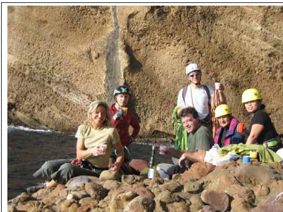
Le repas bien mérité, avec la fin de la C45 derrière (trace grise)