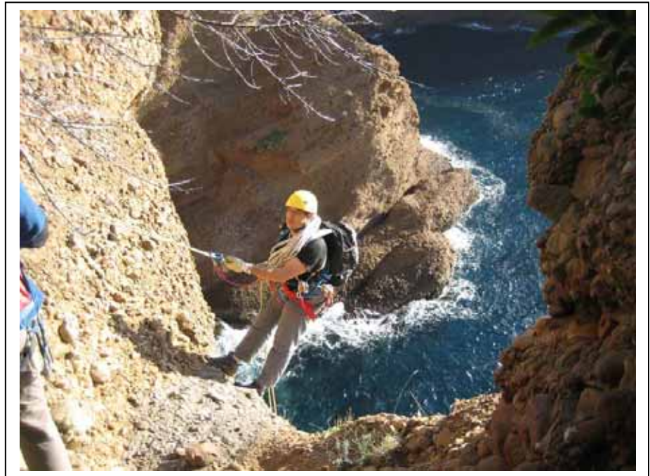
Votre serviteur au départ de la cascade des Pirates