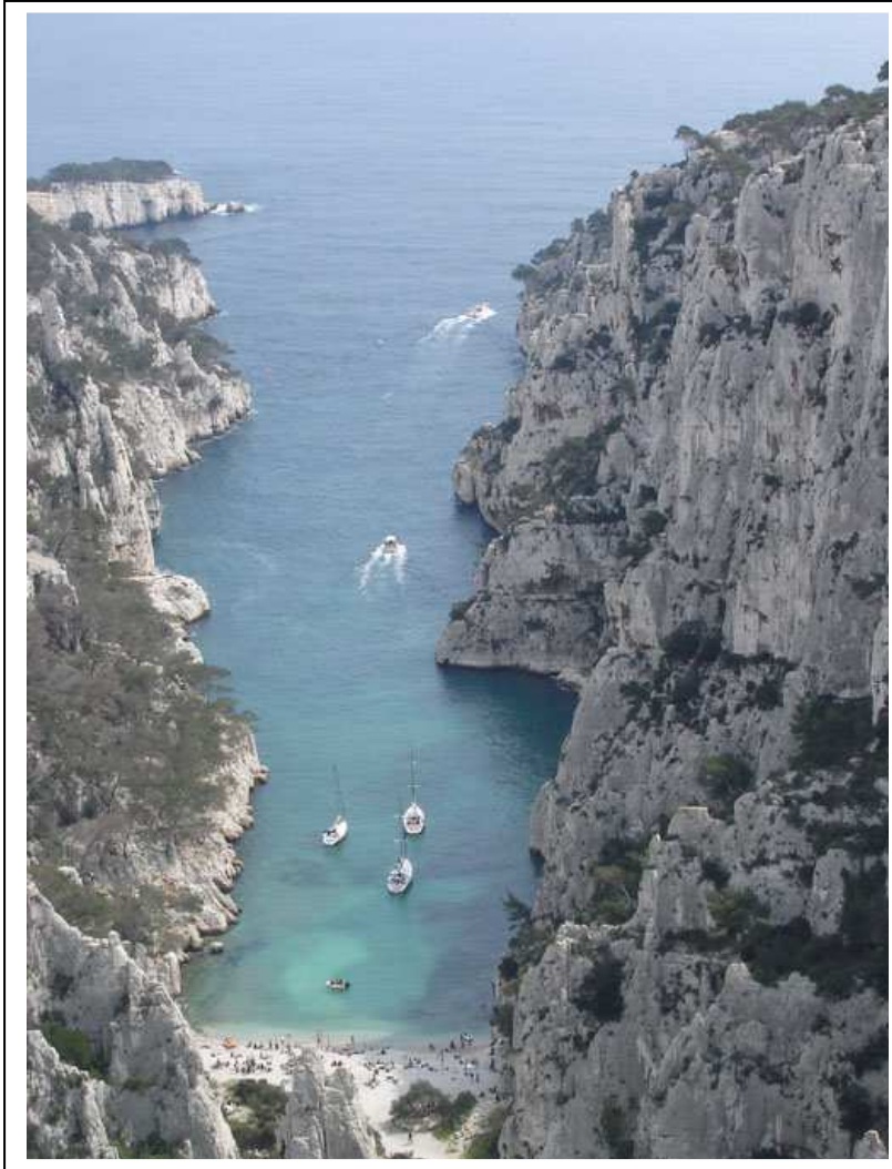
En Vau depuis le Belvédère