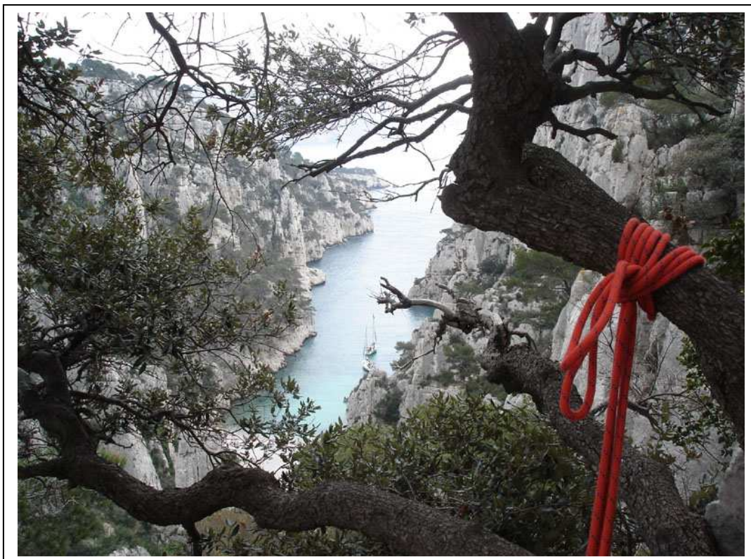
En Vau, depuis l'arrivée du second rappel à la brèche de Castelviel

est vrai que nous l'avions rencontré lors de la dernière sortie escalade à Morgiou où nous étions particulièrement, comment est-ce qu'il a dit déjà, ah oui Marseillais, particulièrement Marseillais c'est ça... Ce jour là, nous étions beaucoup et plutôt dissipé, nous avons mis l'ambiance sur la falaise.