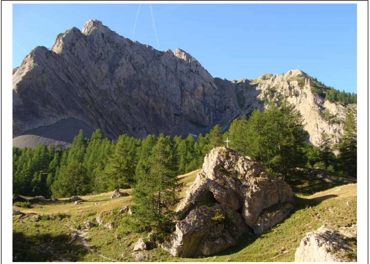
Le Pic de Furfande et la roche aux Marmottes