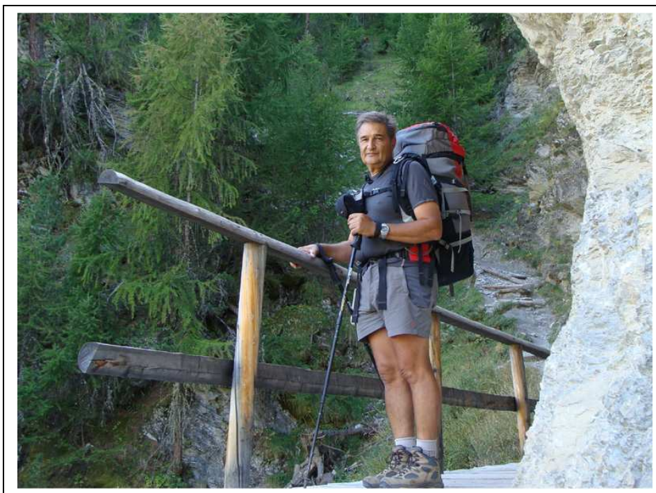
Votre serviteur sur le sentier de montée au Lac Miroir