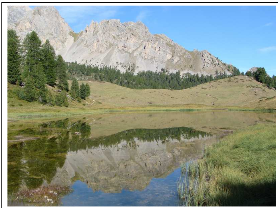
Le Lac Miroir, qui porte bien son nom