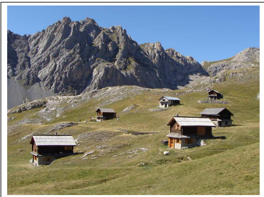
Le hameau des Granges de Furfande