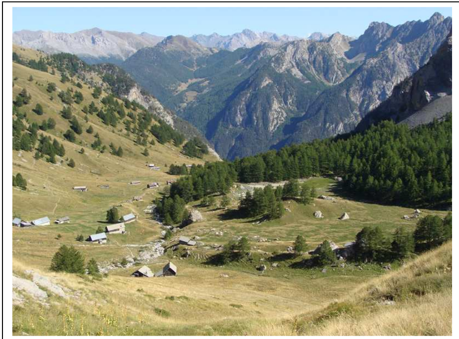
Le hameau des Chalets de Furfande et notre lieu de bivouac à droite

Le temps est toujours aussi magnifique ce matin et vers 9 heures nous prenons la route d'Arvieux, plus précisément vers le parking du Queyron. Un peu après le village de Villargaudin, la route devient piste forestière sur 6 km mais elle est largement carrossable à faible allure. Vers 9 h 30, nous arrivons au parking du Queyron (1982m) et nous sommes surpris par la beauté de l'endroit. Sur un petit col, avec un grand champ et une forêt de grands mélèzes où on a installé des tables de pique nique et des barbecues fixes.