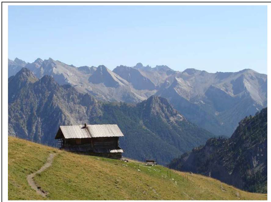
Un des nombreux Chalet du hameau des Granges de Furfande