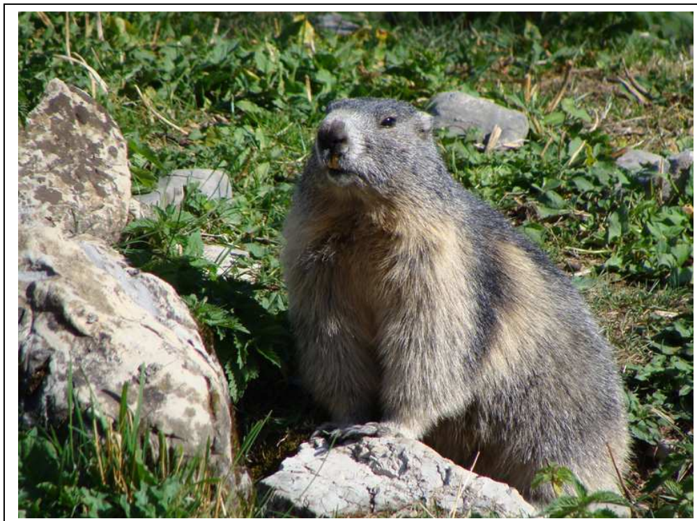
La nouvelle star du Miroir