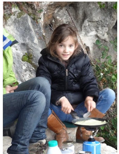
8) Cuisinière en herbe...