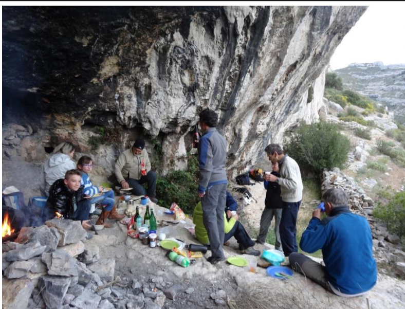
2) Début de la crêpe-partie....