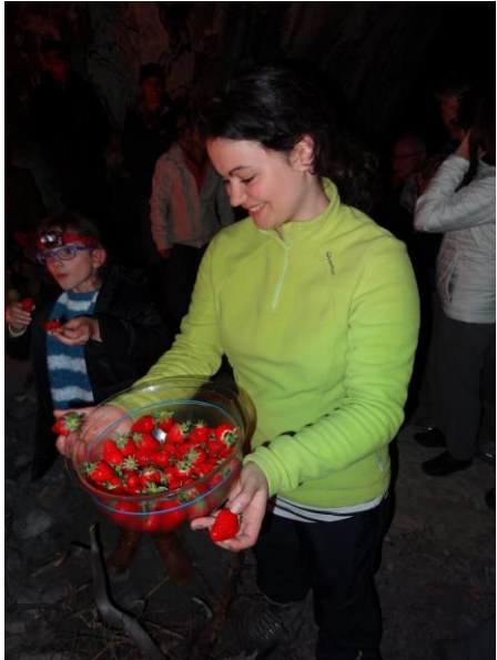
5) il y a même des fraises...