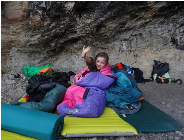
7) Le réveil d'Ikona ...