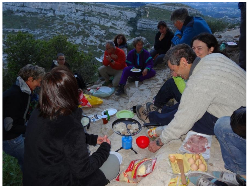
3) Crêperie avec vue sur les collines.