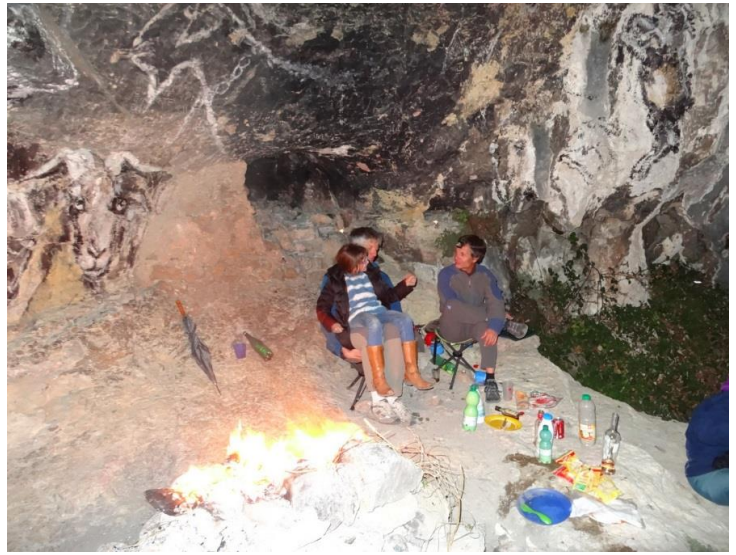
6) Le calme est revenu, détente et digestion au coin du feu...