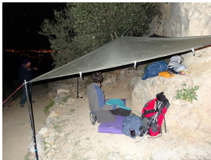
9) L'abri de bivouac chevillé à la falaise ...