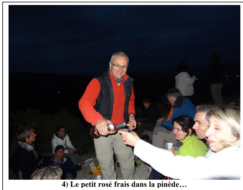
4) Le petit rosé frais dans la pinède...