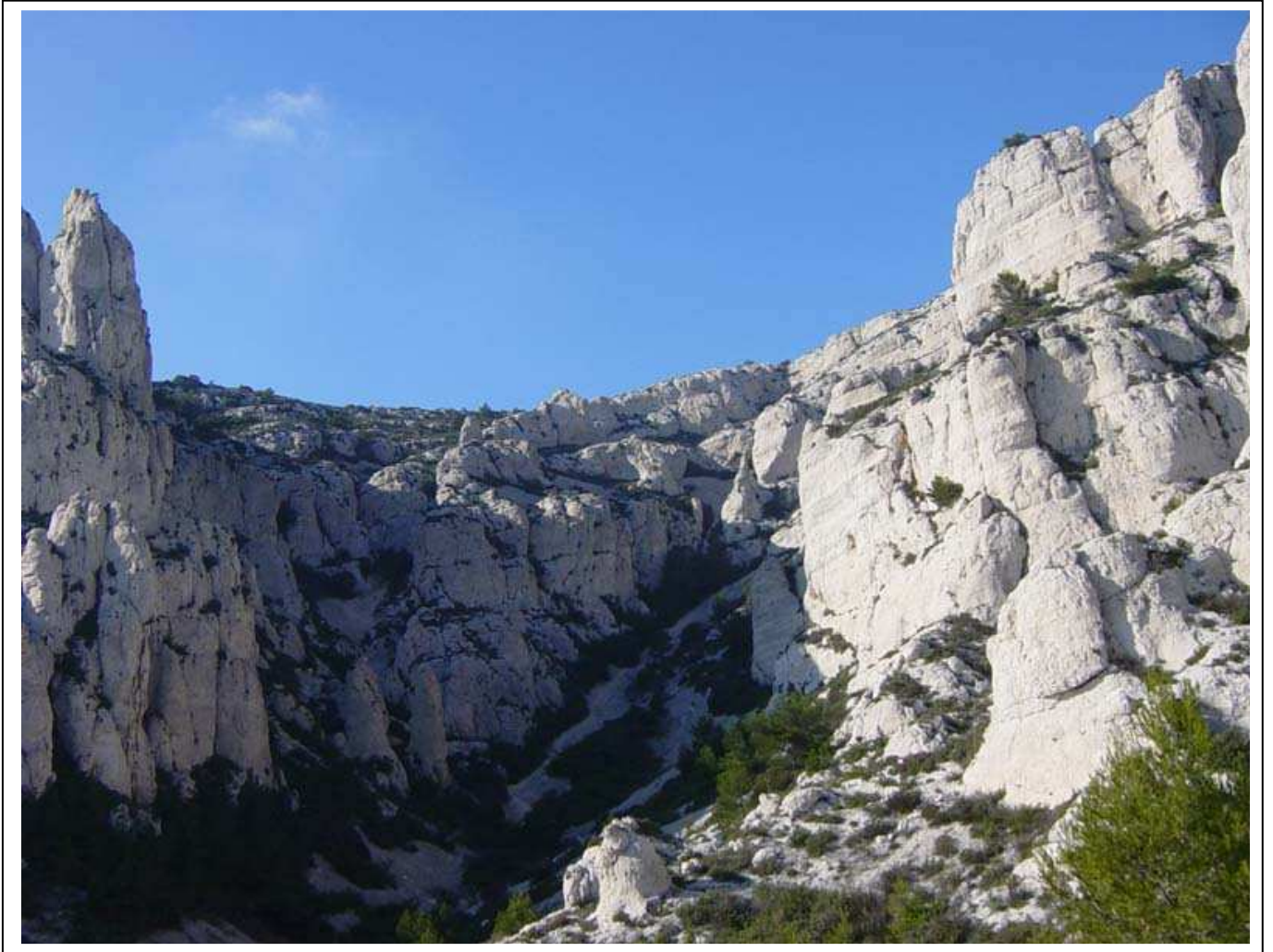
Le cirque des Walkyries avec le sentier dans la partie de gauche

Un second arbre permet éventuellement de fractionner la descente, dans ce cas, une corde de 20 m serait suffisante. Mais la 30 m permet d'arriver directement au pied de la falaise.