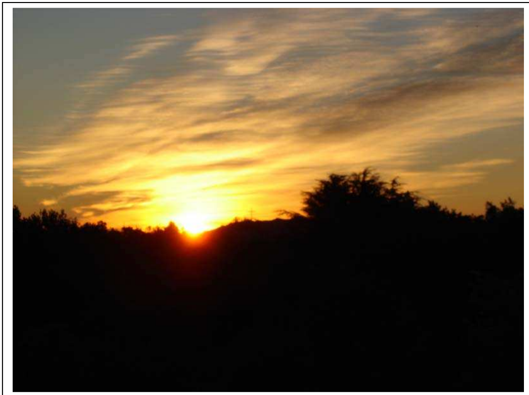
Le soleil perce la couche de nuage sur la croix orientale de la Sainte Baume