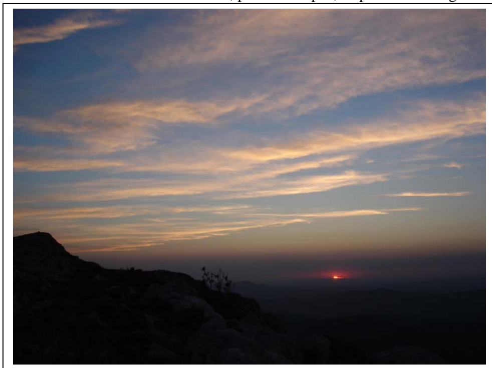
Fin du coucher de soleil sur la Côte Bleue