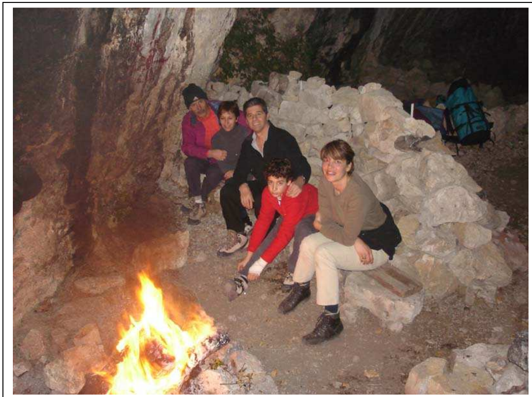
Un « remake » des veillées d'antan autour de la cheminée !

La mer est camouflée dans un voile vaporeux que les premiers rayons de soleil transpercent en irisant les roches blanches d'une couleur douce et orangée.