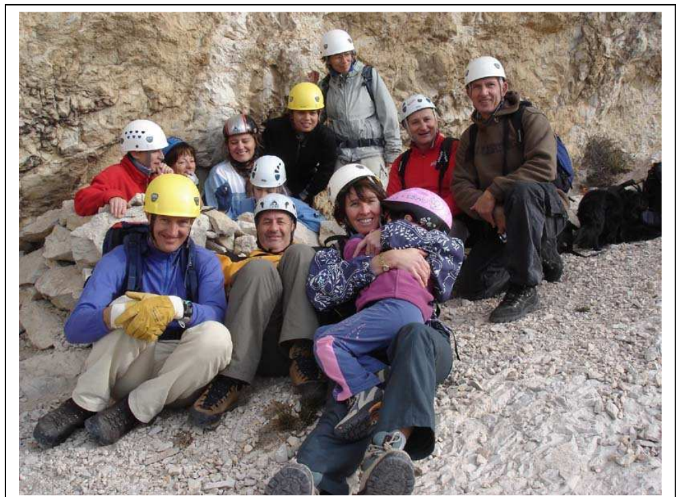
Une belle brochette de randonneurs

Au pied de la croix, nous faisons une petite halte pour le plaisir des yeux, avant de repartir vers le gouffre du Garagai. C'est un trou béant creusé dans le faite de la montagne qui débouche au pied de la falaise en face sud. Dans cette plongée souterraine, une sorte de toboggan extrêmement patiné nous oblige à jouer au petit train afin de descendre sur les fesses, les moins expérimentées d'entre-nous.