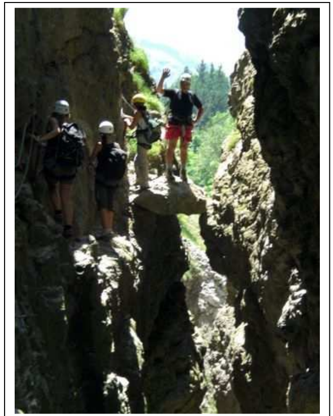
5 Nos 3 grâce et votre serviteur sur le bloc coincé