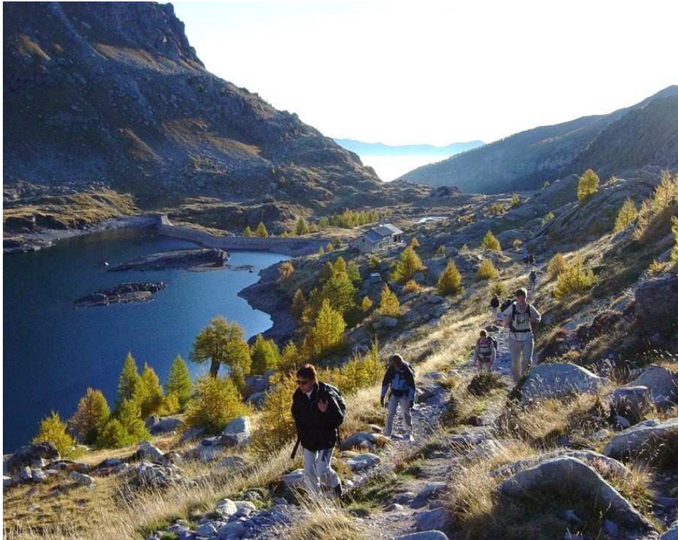
Randonnée - Vallée des Merveilles - Départ du refuge éponyme au lever du jour

La section montagne de l'USPEG vous propose de participer à ses activités.